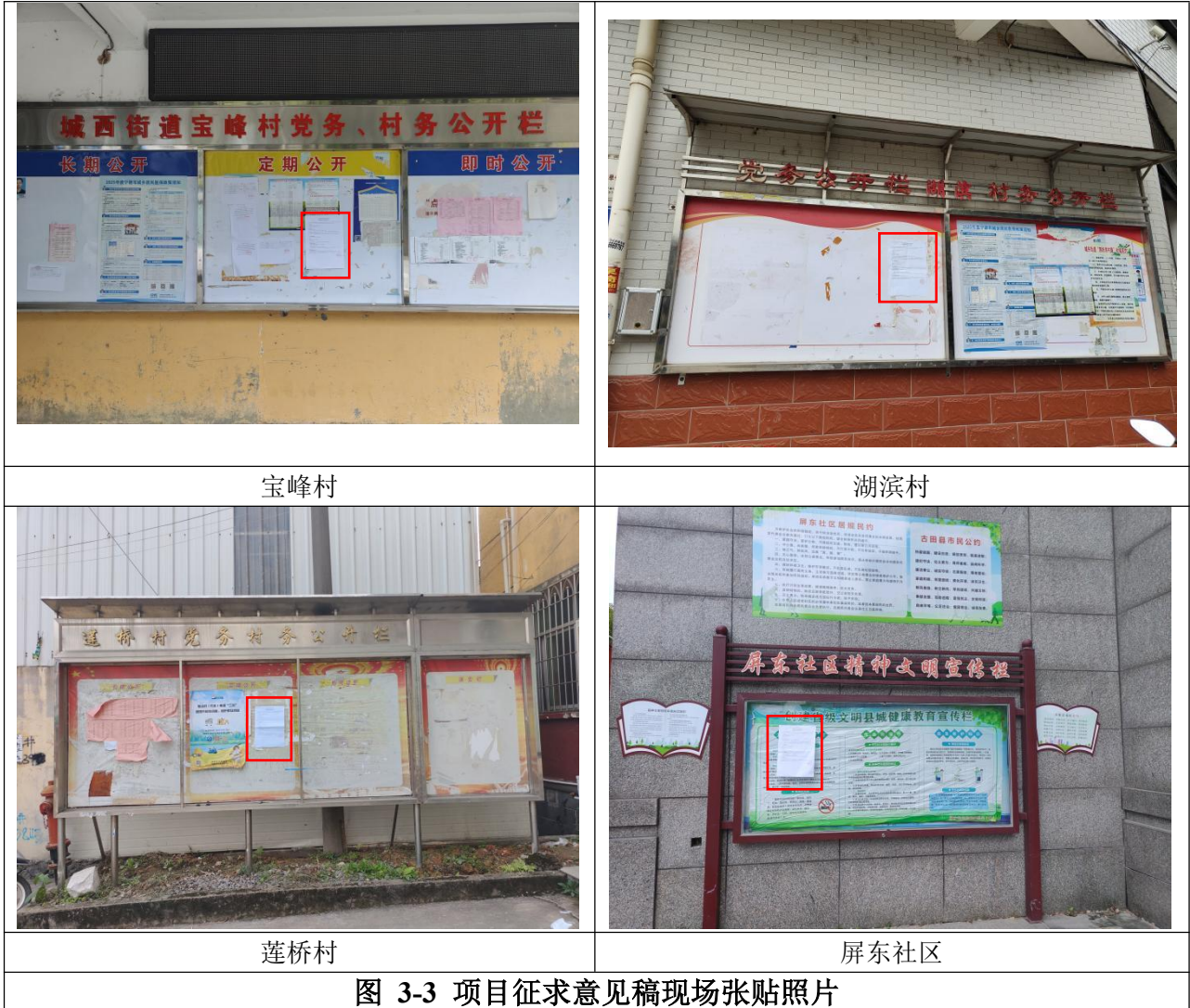
图 3-3 项目征求意见稿现场张贴照片

本项目编制征求意见稿后在进行网络公示、登报公示的同时，同步进行现场张贴公示。我单位在宝峰村、湖滨村、莲桥村、屏东社区宣传栏张贴公告，公示期限为 2024 年 12 月 2 日~12 月 12 日，具体详见下图。