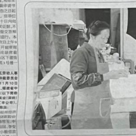
检察官宣读判决书。

霞浦县检察院运用赔偿保证金制度，使双方当事人合法权益得到法律保障，进而促使双方矛盾得到有效化解，实现了政治效果、社会效果、法律效果的有机统一。