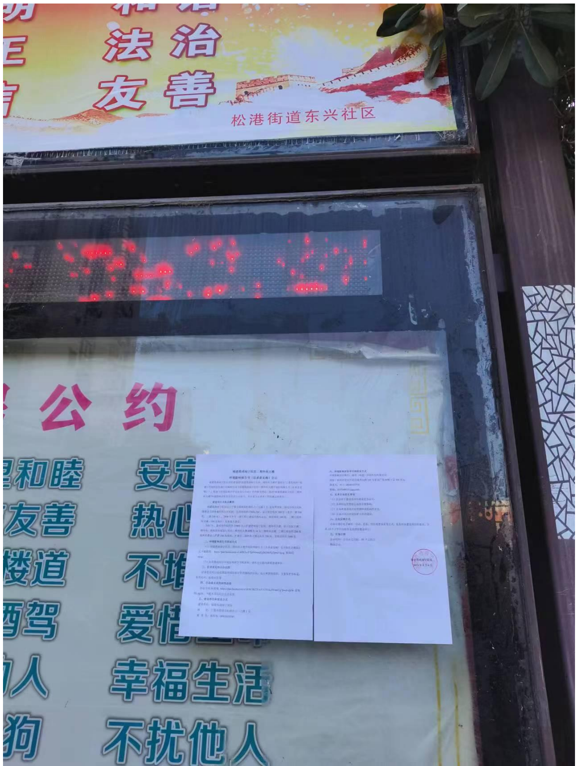
图 3.2.5 现场张贴公示（东兴社区）