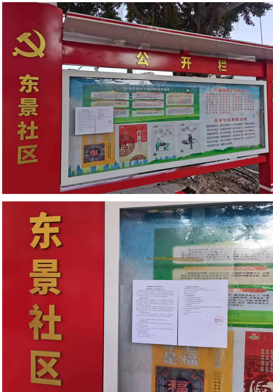
图 3.2.4 现场张贴公示 (东景社区)

兴社区、东景社区)张贴环评公示,向公众公开项目及环境影响报告书征求意见下载途径等信息。公示时间为10个工作日。公示情况见图3.2.4。